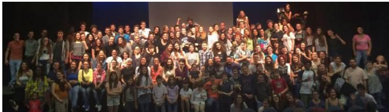
La celebrazione dei vent'anni del Festival con i partecipanti delle passate edizioni, dal 1995 al 2015

2020 - prosegue il lavoro della Compagnia con gli adolescenti e sul territorio attraverso il progetto artistico e di cittadinanza attiva Politico Poetico