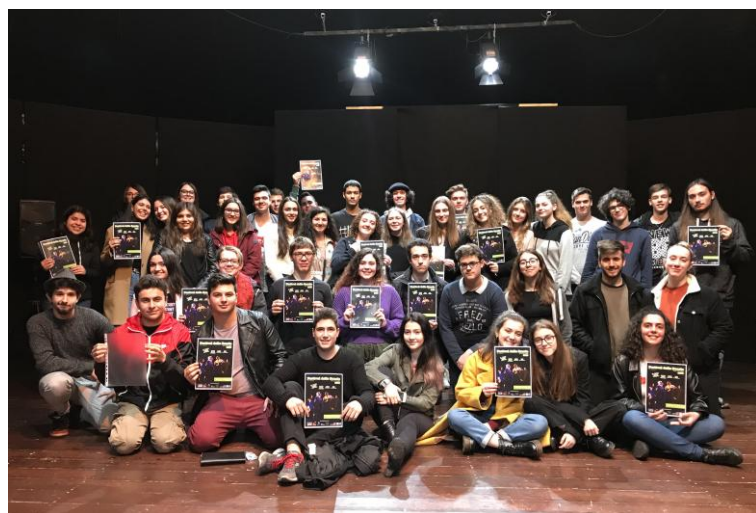
Festival 2019: la Giuria di ragazzi e ragazze

Il Festival delle Scuole è un Concorso di Teatro a cui sono ammessi, previa compilazione della domanda allegata, gruppi di teatro delle Scuole Secondarie di 2° grado . Il concorso si svolge durante il mese di maggio e la cerimonia di premiazione dei vincitori si tiene domenica 24 maggio 2020 all'ITC Teatro di San Lazzaro. L'iscrizione è gratuita . Per partecipare è sufficiente, dopo aver letto il bando di concorso, compilare e firmare il modulo di iscrizione e la scheda di partecipazione allegati e inviarli con le modalità e nei tempi indicati. I gruppi partecipanti si esibiscono davanti a una giuria composta interamente da ragazzi e ragazze , provenienti da tutte le scuole in concorso, che dovranno valutare testo e recitazione, grado di difficoltà e originalità, costumi, scene e musiche degli spettacoli in gara. La giuria è senz'altro una delle cose più belle nonché il simbolo di questa rassegna dedicata ai più giovani. Al termine della manifestazione, la scuola prima classificata riceverà un premio in denaro pari a euro 1.500 , che la scuola si impegna a spendere nell'organizzazione di attività culturali destinate agli allievi, nonché il diritto a partecipare all'edizione 2021 della Manifestazione Teatro Lab organizzata dal Centro Teatrale Europeo Etoile sul territorio della Provincia di Reggio Emilia.