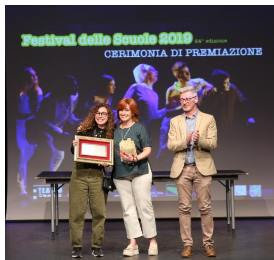
I vincitori dell'edizione 2019: Liceo Scientifico Statale G. Salvemini di Bari